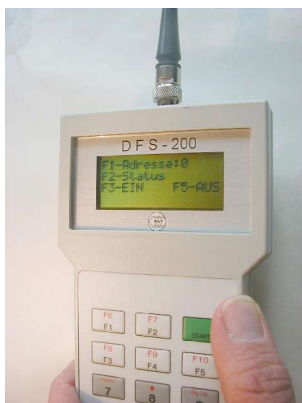
DFS200 - Handsender